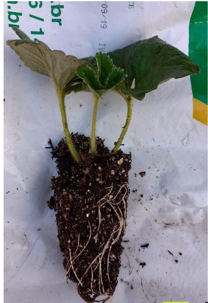
Total até o momento 4 aplicações.