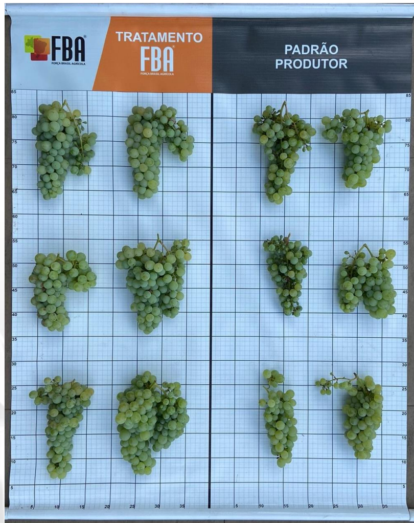
Figura 4 – Diferença visual na uva variedade moscato na colheita