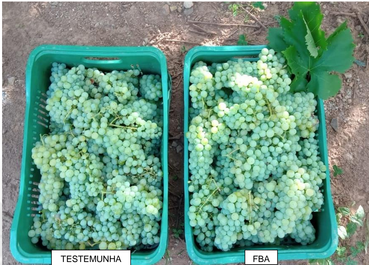
Figura 3 – Diferença visual na uva variedade moscato na colheita