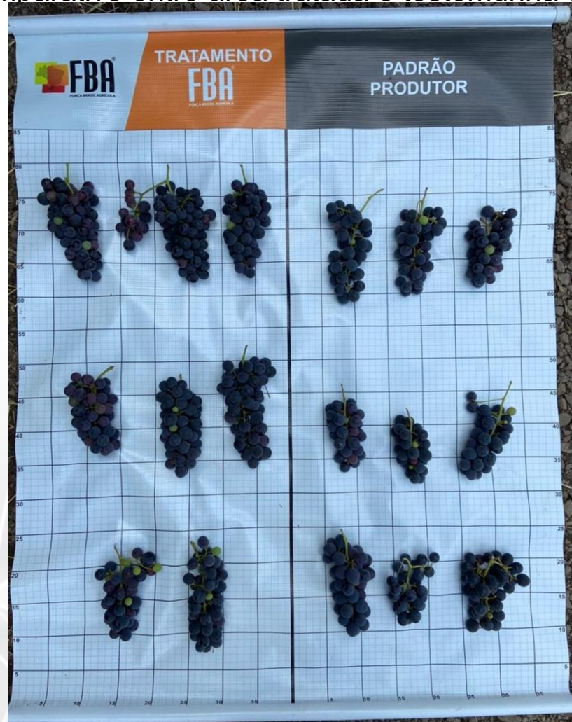
Figura 3 – Comparativo entre área tratada e testemunha das amostras coletadas.