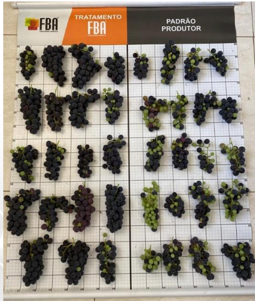
Figura 3 – Comparativo entre área tratada e testemunha das amostras coletadas.